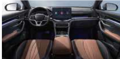
Schwarz und braun